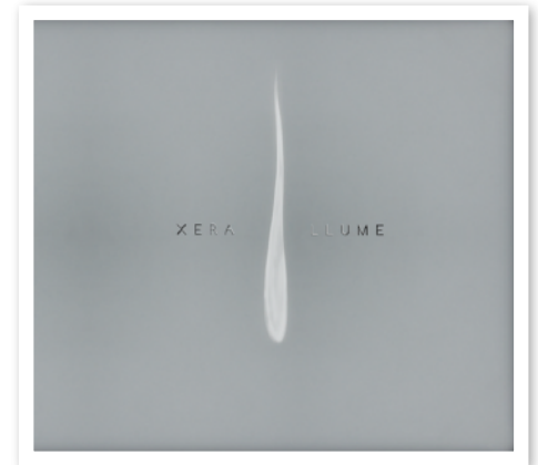
"Llume" - 2012

Xera, a la vanguardia del género combinando estructuras tradicionales folk con elementos electrónicos