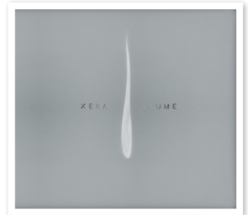
“Llume” - 2012

Xera, a la vanguardia del género combinando estructuras tradicionales folk con elementos electrónicos