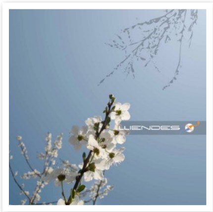
“Lliendes” - 2006